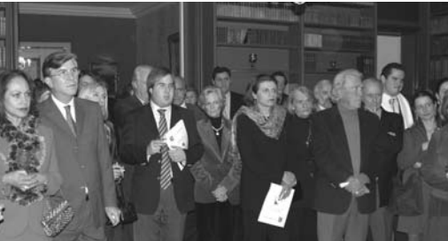
¡Todos muy atentos!