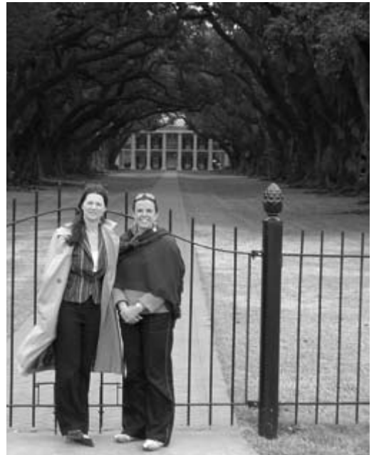
Devant la majestueuse allée d'une plantation

Cela nous paraît beaucoup plus logique : rappelons que cet immense territoire de plus de 2 millions de km 2 (15 états actuels des Etats-Unis) venait récemment d'être vendu