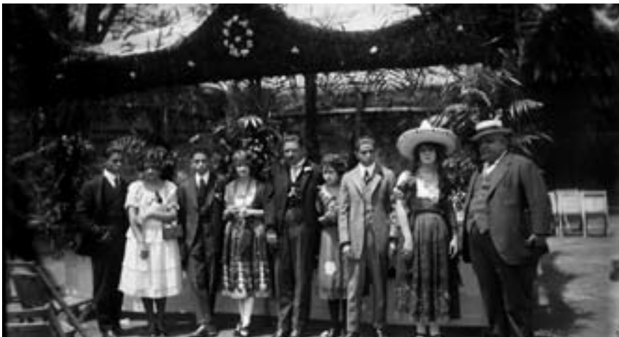
Kermesse del 14 de julio ca 1920.

E n 1789, la toma de la Bastilla marcó el inicio de la Revolución Francesa y, con el tiempo, este hecho sangriento ha trascendido hasta convertirse en un símbolo en torno al cual se identifican alrededor del mundo los valores republicanos de libertad, igualdad y fraternidad. Sin embargo, no fue sino hasta 1880 cuando el Parlamento francés estableció el 14 de Julio como la fiesta nacional de Francia, noticia que fue acogida con gran regocijo en México, quien ese mismo año acababa de reanudar sus lazos diplomáticos con Francia limando las asperezas originadas por la guerra de Intervención. Muestra de este renovado espíritu conciliador fue la decisión que tomó el Congreso mexicano de levantar la sesión el siguiente 14 de julio en honor a la celebración de la fiesta francesa, declarada por un diputado “fiesta de la humanidad”.