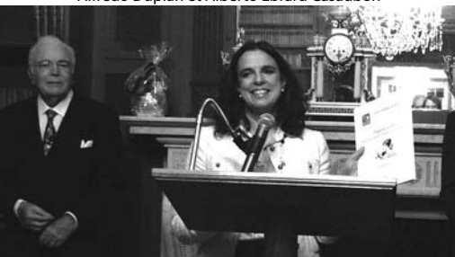
Nuestra presidenta con el “cahier RFM No 3”