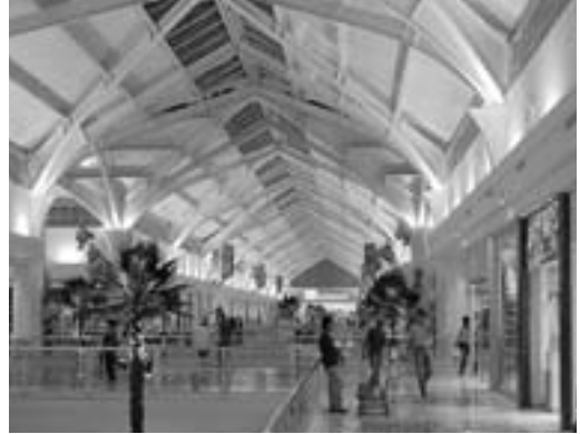
Galerías Laguna en Torreón, Coahuila

superior se instalan las bodegas y “el mayoreo” para surtir pequeñas tiendas de provincia. Los comerciantes, alentados por la inauguración en 1909 del sofisticado edificio estilo Hausman de “Las Fábricas Universales” de Alexandre Reynaud, contratan afamados arquitectos y artesanos para edificar los nuevos almacenes con diseño de vanguardia, rematándolos a menudo con un torreón o vidrieras al estilo de los grandes almacenes parisinos.