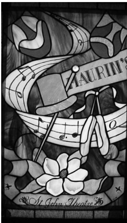
Maurin, village de l'Ubaye, apparaît sur le vitrail du théâtre de la paroisse St. Jean

Sans doute parce qu'ici les français n'ont jamais ressenti le désir de rentrer au pays, fortune faite.