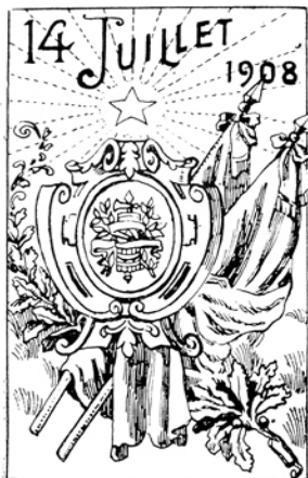
Frente y vuelta de la cajetilla de El Buen Tono para los festejos del 14 de julio de 1908, publicadas en El Mundo Ilustrado