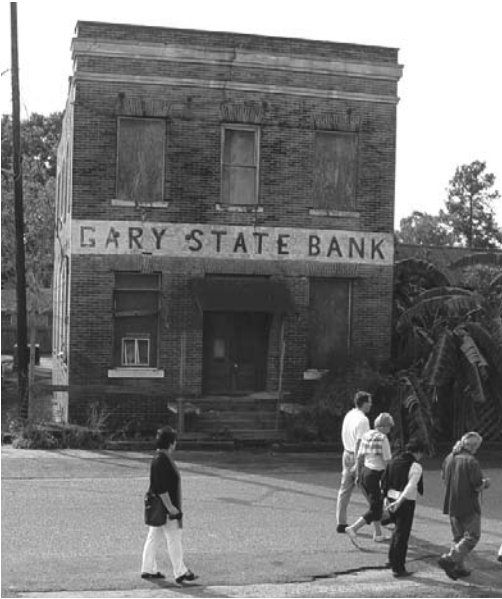
Une banque Barcelonnette de la Paroisse St. Jean en face de la jettée du Mississippi