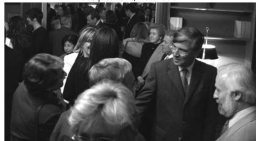
¡Comentando la velada!